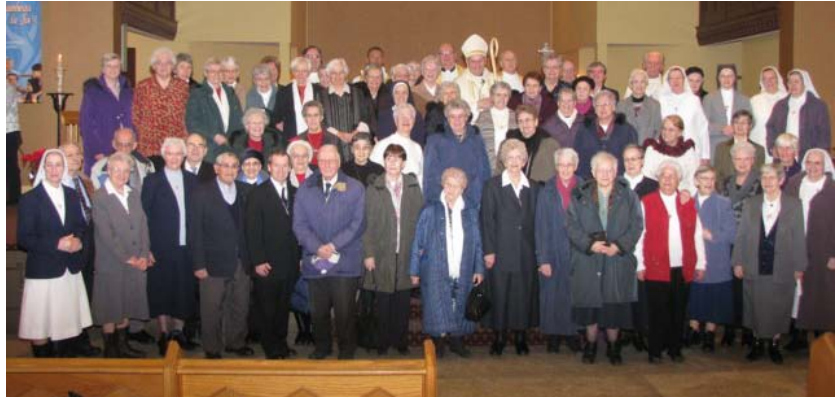
Membres d'Instituts de vie consacrée présents à la célébration d'Action de grâce